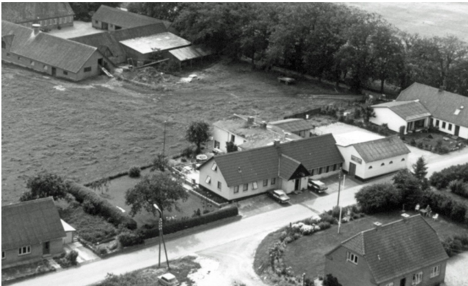
Tulstrup kro 1978